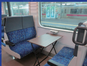
ボックスシート占有 テーブルあり・定員4名