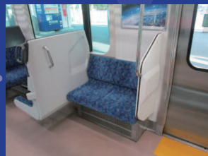
エコノミーロング占有 テーブルなし・定員2名