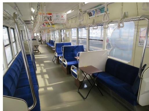
青鉄全線完全走破号車内の様子（イメージ）