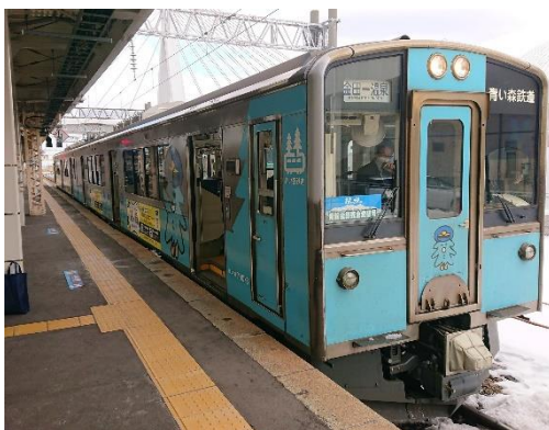
青鉄全線完全走破号（イメージ）