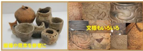
自分だけのオリジナル土器を作ってみよう!

出土品の展示や保管、遺跡に関する情報発信など小牧野遺跡保護の拠点です。縄文時代の生活や文化を学び、実際にミニチュア土器を作ります。