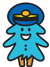
青い森鉄道イメージキャラクター「モーリー」

北海道・青森県・岩手県・秋田県に所在する17の遺跡で構成されており、2021年7月に世界文化遺産に登録されました。