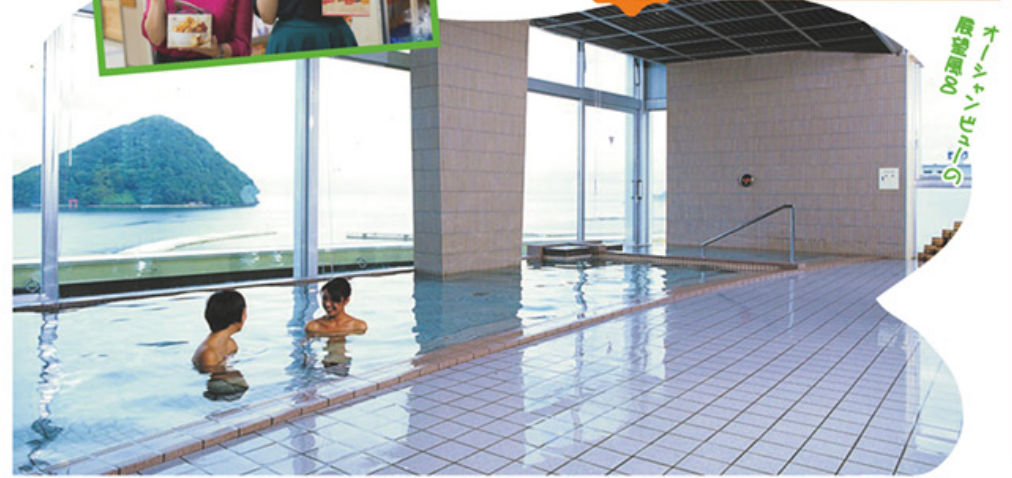
お風呂の お風呂の お風呂の