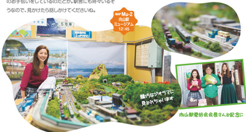
精巧なジオラマに 見とれちゃいます