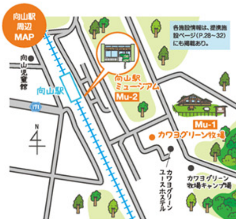
MAP Mu-2 向山駅 ミュージアム 12:45

食後は、向山駅へ。現在は無人駅となった駅舎で、土・日・祝日のみ向山駅愛好会が運営している「向山駅ミュージアム」を見学します。鉄道ジオラマや国鉄時代の貴重な備品の数々の展示、愛好会会員が育てた野菜の直売、レンタサイクルの貸出など、さまざまな企画で駅や駅周辺の活性化を目指している向山駅愛好会。萌奈美はそのキャンペーンガールを務めています。向山駅があるおいらせ町のお祭りなどにも参加して、PRのお手伝いをしているのだとか。駅舎にも時々いるそうなので、見かけたら話しかけてくださいね。