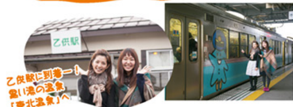
乙供駅に到着！ 黒い湯の温泉 「東北温泉」へ

幸せいっぱい気持ちのまま、次に向かったのは乙供駅。行く先は、「美人泉質」として名高い「東北温泉」です。肌の汚れや角質を落とすアルカリ性で、天然保湿成分を多く含むため、美肌効果があるとされています。しかし、驚くことに、この温泉のお湯は真っ黒。黒さの元は亜炭で、この亜炭が含まれる層を通過して湧出する温泉は「モール(ドイツ語で亜炭の意)温泉」と呼ばれ、かつては世界でも、保養地で名高いドイツのバーデンバーデンと北海道・十勝川温泉の2ヶ所しかない稀少なものだったとか。掘削技術の進歩で日本国内でも多少湧出が見られるようになった今も、国内のモール温泉の中で「最も色が黒い温泉」という評価を得ているこちら。それにちなんで黒い県産食材だけを集めた「黒づくし御膳」が食べられます。「今回はお風呂だけでなく、食事付き入浴バックで来ようね」