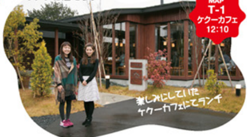
MAP T-1 クークーカフェ 12:10