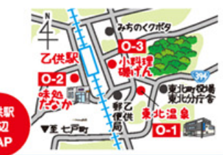
乙供駅 周辺 MAP