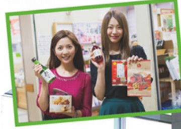
お土産の お土産の お土産の

ボウのムース 季節のフルーツ添え」です。実は夏恋はゴボウが苦手。でも、恐る恐るスプーンを口に運んだ次の瞬間「おいしい!」と、笑顔で完食してしまいました。さあ、あとはお土産を買って、お風呂にゆっくり浸かって帰りましょう。浅虫温泉駅前の「道の駅ゆ〜さ浅虫」の5階にある展望風呂「はだか湯」は、大きな窓から陸奥湾を一望できる開放的な温泉。体も心もびのびとリラックスできます。楽しい一日の締め括りの温泉は最高です。