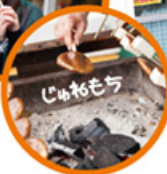
MAP S-5 きんか堂