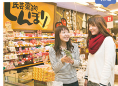
県南ならではの郷土菓子がずらり