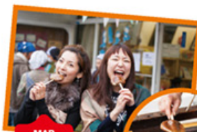
MAP S-4 まちの楽校

そして、欠かせないのはやっぱり三戸特有のあっさりめのコナモン。「まちの楽校」では串刺した焼き立ての「じゅねもち」、「きんか堂」ではくるみゴマ餡たっぷりの「きんかもち」が食べられます。今回は、「三戸せんべい」や「ひっつみ」もぜひ。