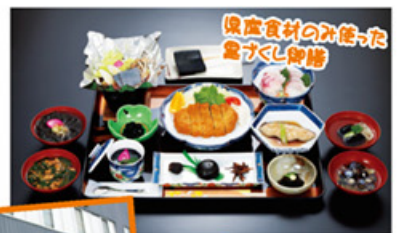
県産食材の外産した 黒づくし御膳