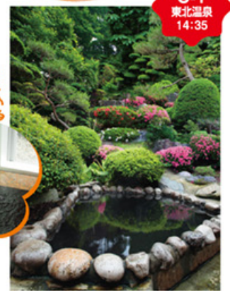
MAP O-1 東北温泉 14:35