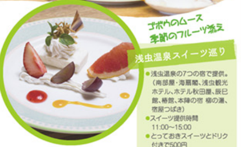
ゴボウのムース 季節のフルーツ添え 浅虫温泉スイーツ巡り