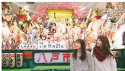
ユートリー内に常設展示されている三社大祭の山車

満員のバスに揺られて到着した八食センターは、新鮮な魚介はもちろん、地酒、青果、惣菜、土産物などが揃うほか、飲食店街もあり、ありとあらゆる美味が集まり、活気にあふれていて、見ているだけでもわくわく。今日のお目当は炭火焼のお店「七厘村」での食事です。まずはお店で席を確保し、食べたい魚介を探して売り場を行ったり来たり。目移りしつつもお買い得なBBQセットに決定。買ったお店でお金を払い、食べやすいように処理してもらいます。受け取った魚介を手