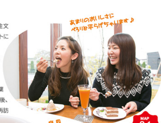
あまののびに べしは平らげちゃいますよ

幸せいっぱい気持ちのまま、次に向かったのは乙供駅。行く先は、「美人泉質」として名高い「東北温泉」です。肌の汚れや角質を落とすアルカリ性で、天然保湿成分を多く含むため、美肌効果があるとされています。しかし、驚くことに、この温泉のお湯は真っ黒。黒さの元は亜炭で、この亜炭が含まれる層を通過して湧出する温泉は「モール(ドイツ語で亜炭の意)温泉」と呼ばれ、かつては世界でも、保養地で名高いドイツのバーデンバーデンと北海道・十勝川温泉の2ヶ所しかない稀少なものだったとか。掘削技術の進歩で日本国内でも多少湧出が見られるようになった今も、国内のモール温泉の中で「最も色が黒い温泉」という評価を得ているこちら。それにちなんで黒い県産食材だけを集めた「黒づくし御膳」が食べられます。「今回はお風呂だけでなく、食事付き入浴バックで来ようね」