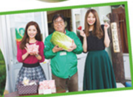
向山駅愛好会会長さんと記念に