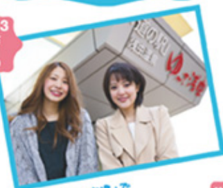
「ゆへさ市場」で卵を買いほべ