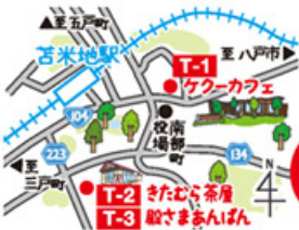
苔米地駅 周辺 MAP