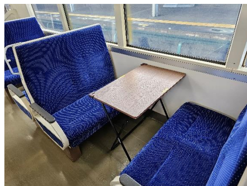
青い森 701 系 ボックスシートイメージ