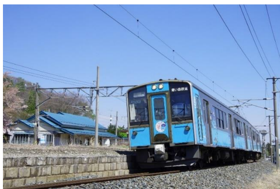
青い森 701 系 イメージ