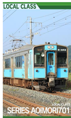
当社運転カードの一例