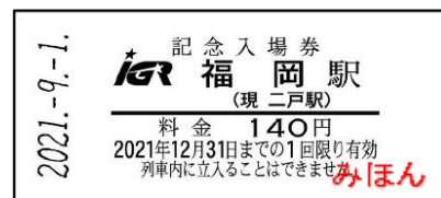
(IGRいわて銀河鉄道入場券の一例)