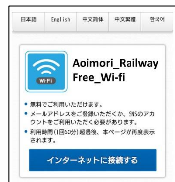
無料 Wi-fi 認証画面