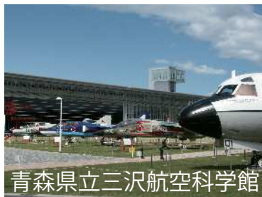
青森県立三沢航空科学館