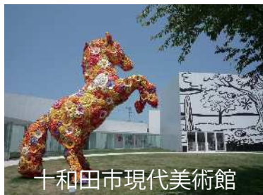
十和田市現代美術館