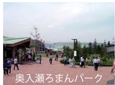
奥入瀬ろまんパーク