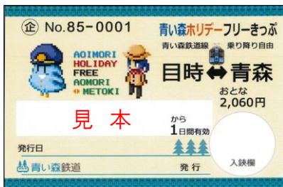
青い森ホリデーフリーきっぷ